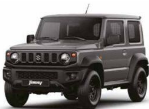
Medium Gray (ZVL)