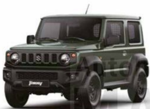
Jungle Green (Z2C)