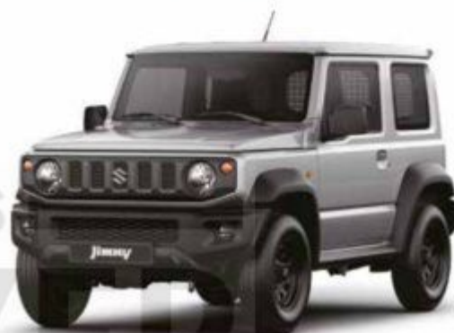
Silky Silver Metallic (Z2S) 1)