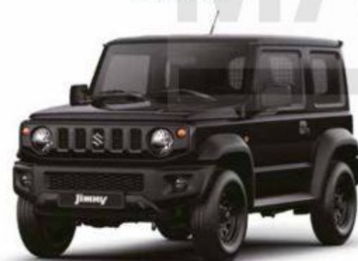
Bluish Black Pearl 3 (ZJ3) 1)